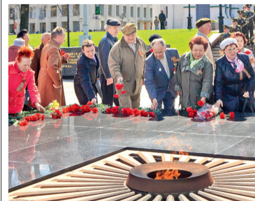
Пенсионеры Гипрогазцентра возлагают цветы к Вечному огню

Уже традиционно в начале мая в Гипрогазцентре проводятся торжественные мероприятия, посвященные празднованию Дня Победы. 3 мая в Большом зале Общества собрались ветераны Великой Отечественной войны, бывшие работники Гипрогазцентра.