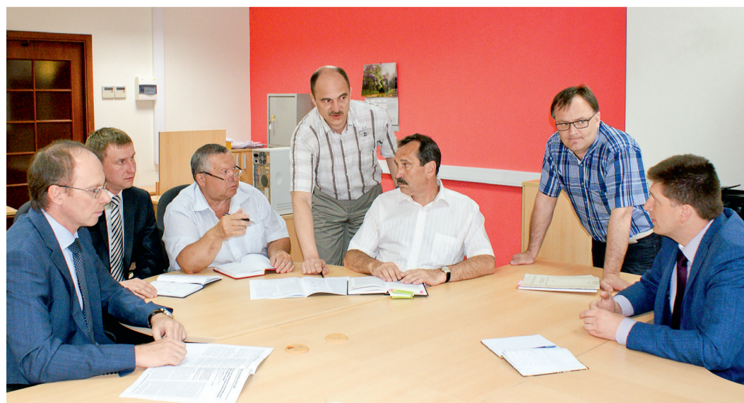
Производственное совещание специалистов Центра

В целях обеспечения комплексного подхода к выполнению работ по оценке технического состояния объектов транспорта газа с учетом существующих требований надежности, в апреле 2012 года в структуре Гипрогазцентра создан Центр прочности, надежности и диагностики трубопроводов и технических устройств.