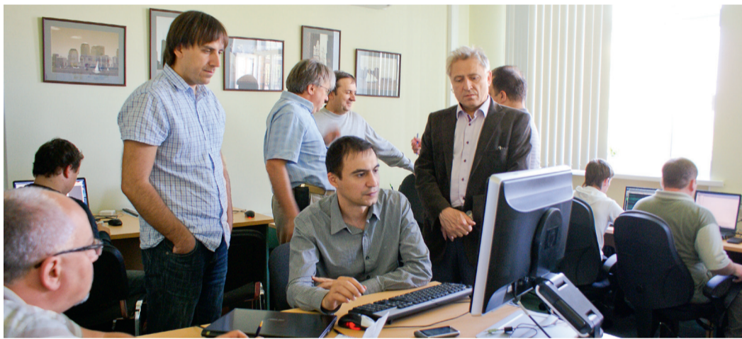
Проверка передачи параметров с участием представителей ООО «Газпром трансгаз Нижний Новгород»

С 14 по 17 мая на Полигоне ОАО «Гипрогазцентр» прошли комплексные испытания интегрированной автоматизированной системы управления технологическими процессами (ИАСУ ТП) компрессорной станции «Вязниковская». Для участия в испытаниях в Большой Ельне собрались представители организаций-изготовителей основных подсистем ИАСУ ТП КС.