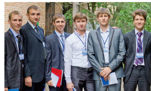
Участники научно-практической конференции молодых специалистов в г. Донецк

Проблема еще и в том, что серьезная производственная загруженность инженера может вызвать желание отказаться от продолжения написания доклада в пользу основной работы. Бесспорно, основная работа превышает все, поэтому в данной ситуации многое зависит от психологического настроя участника, от его желания доработать