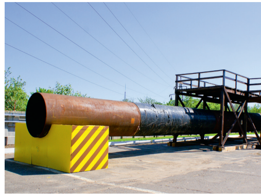
Испытательный полигон в Большой Ельне

Дистанционный коррозионный мониторинг — это принципиально новое для Газпрома направление, и его развитие — одна из основных перспектив созданного Центра. У Гипрогазцентра уже есть определенные наработки в этой сфере. С участием