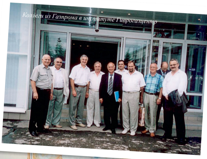
Коллеги из Газпрома в институте Гипрогазцентр