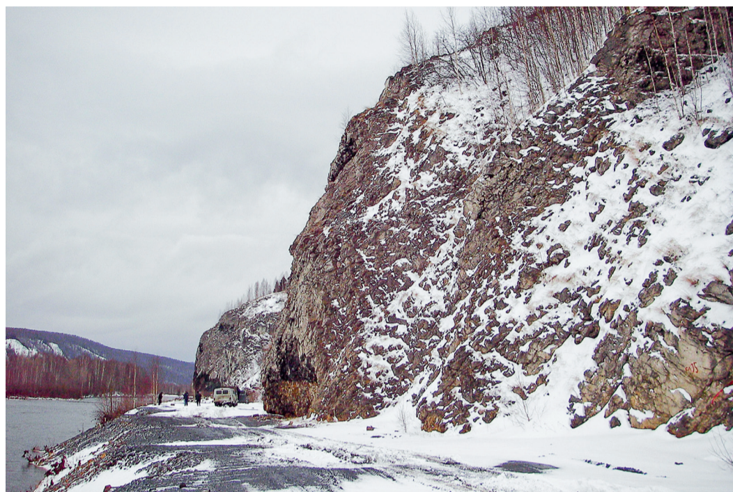
Сложные природные условия местности прохождения трассы газопровода. Река Косьва

В июне 2012 года ОКП ЛЧ МГ приступил к реализации проекта «Реконструкция газопроводов «Чусовой — Березники — Соликамск - 1,2 (ЧБС-1, ЧБС-2)». Данные газопроводы являются отводами от магистрального газопровода «Н. Тура — Чусовой — Пермь» и предназначены для снабжения газом промышленных потребителей и жителей Пермского края.