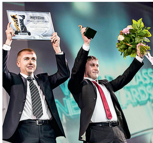
Церемония поздравления Самого крупного корпоранта сету World Class

К нам обращаются с самыми разными вопросами. Мы внимательно рассматриваем все обращения, при необходимости профсоюз оказывает члену организации посильную помощь