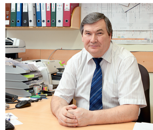
ГИП М.В. Кутыркин

Геодеформационная (геодинамическая) подсистема, обеспечивает непрерывную регистрацию вертикальных и горизонтальных движений земной поверхности посредством производства измерений GPS/ГЛОНАСС — приемниками на потенциально опасных участках (косогоры, оползни, размывы и т.д.). Данная подсистема устанавливается в местах прохождения газопроводов-отводов по горным выработкам, согласно техническому проекту «Геодинамический полигон».