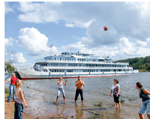
Дружное празднование дня нефтегазовой промышленности