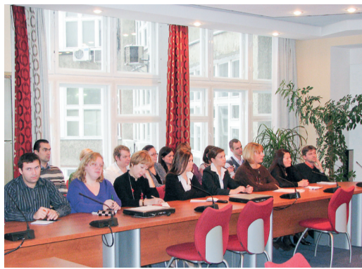
Отчетная конференция профсоюза

Уже более 100 лет в организациях нефтегазовой отрасли функционируют профсоюзные структуры. Их деятельность направлена на защиту прав работников нефтегазового комплекса на всех этапах производства, соблюдение работодателем трудового договора и обеспечение работника всеми необходимыми социально-экономическими гарантиями, создание благоприятных условий для повышения жизненного уровня членов профсоюза и их семей.