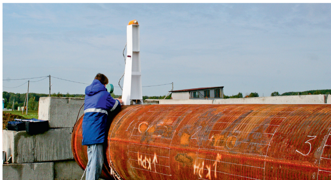
Измерение магнитного поля при проведении гидроиспытаний дефектной трубы

В ходе экспериментальных исследований, проведенных специалистами ЦПНД на полигоне, расположенном на производственной базе Гипрогазцентра в поселке Большая Ельня, а также на участке аварийно-восстановительных работ № 2 в городе Богородске, были получены ценные научные результаты.