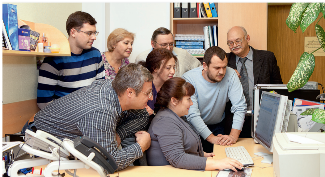
Группа программирования ЦИТТ

Программист — исчезающая профессия, так же как и шофер когда-то. Прошли годы, и все сами научились водить машины. Похожая история с переводчиками, каждый сам теперь норовит вы зубрить пару языков. Вот так и мы — выучились на программистов, думали — будем на века связующим звеном между миром людей и миром машин. А время летит и уже через одного люди сами умеют настроить сложный прибор, у каждого дома компьютер, а то и не один, планшеты, смартфоны. И уж КАК НАДО ПИСАТЬ программы теперь точно знают все, и с удовольствием учат нас этому. И мы учимся.